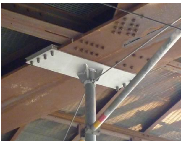
ATTACCO DEL PENDULO NON ISOLATO

Il materiale di cui è composto, resina rinforzata con fibre di vetro G11, garantisce un isolamento ottimale avendo caratteristiche fisiche e meccaniche specifiche per l'uso come da specifiche RFI.